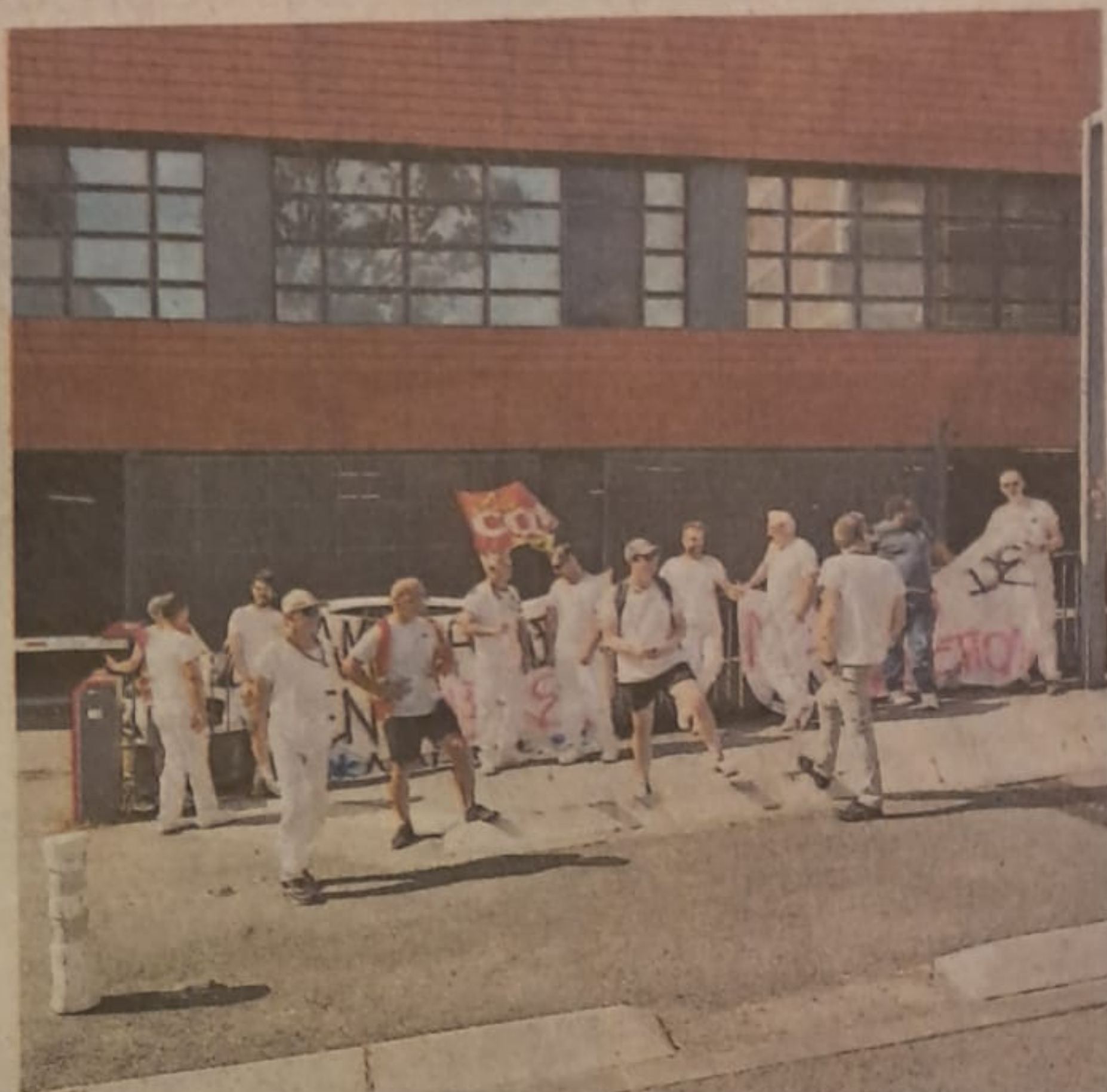
Les ambulanciers grévistes du CHU de Toulouse ont manifesté ce 19 juin devant l'hôpital Pierre-Paul Riquet à Purpan.